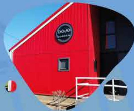
DOJO - GIMNASIO DEPORTE DE CONTACTO