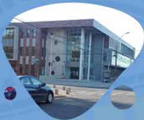
EDIFICIO CONSISTORIAL MUNICIPAL