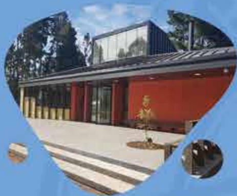
REPOSICIÓN ESC. MELIRREHUE