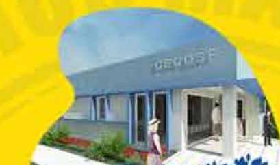
CECOF SECTOR SALINAS