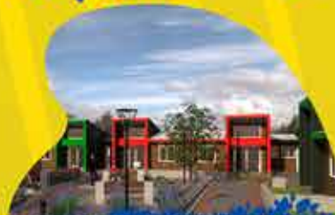
CASAS TUTELADAS ADULTOS MAYORES