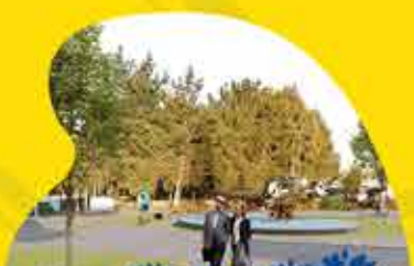
MEJORAMIENTO AV. O'HIGGINS