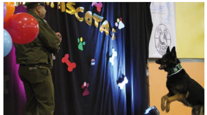
Gorbea disfrutó de ameno desfile de mascotas