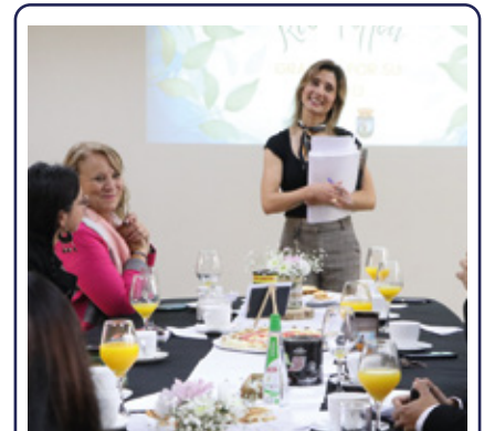
Buscan declarar “Humedal Urbano Río Toltén”