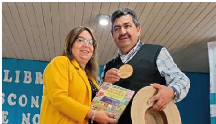
Freire celebró el día del Libro y derecho de Autor