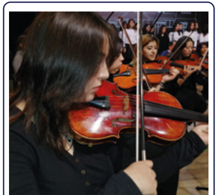
Estudiantes del "Ciencias" presentaron obra musical