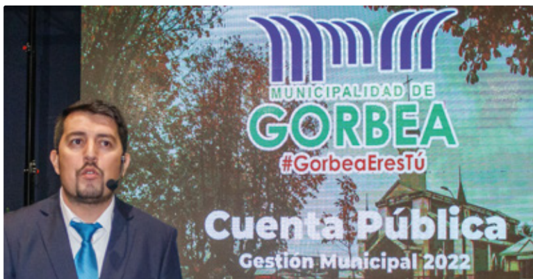
Arias, Romero y Romero Inzunza realizan cuenta pública