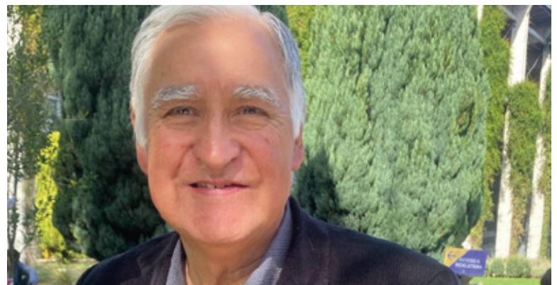
Escritor de Pitrufrquén premiado en concurso literario