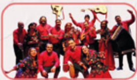
Ballet folclórico Padre las Casas

Artesanía madera, cuero - Cerveza artesanal - Gastronomía - Jugos naturales - Plantas - Juegos tradicionales