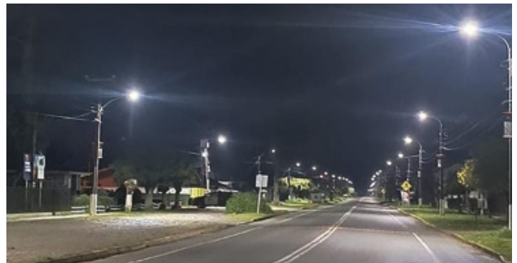
Cambian alumbrado público en villa Comuy