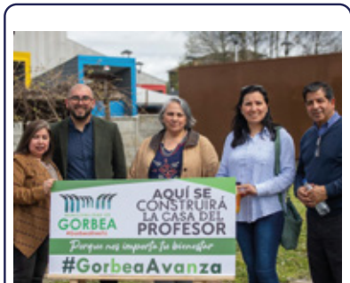
AVANZA CONSTRUCCIÓN DE CASA DEL PROFESOR EN GORBEA