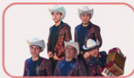
Grupo Los Complices