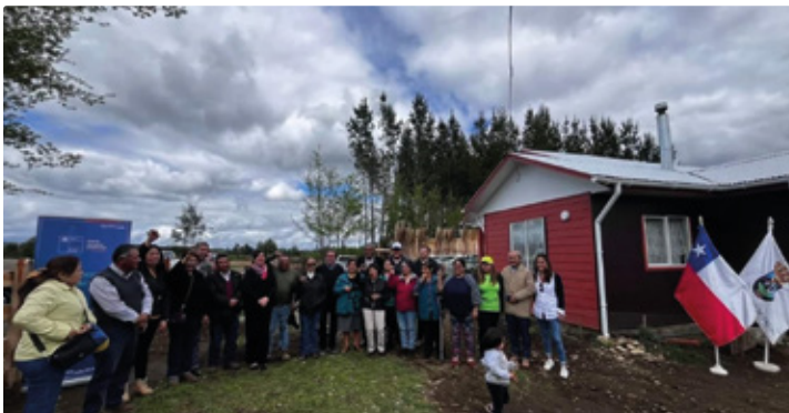
Familias de Freire reciben su anhelada casa propia