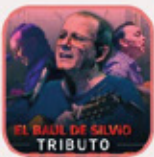
Tributo Silvio Rodríguez