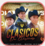
Los Diamantes del allipén