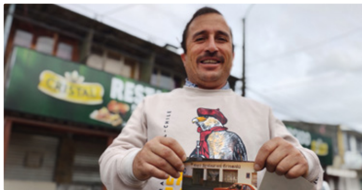
Cierre de Restaurante "Crismalú" tras 39 años de funcionamiento