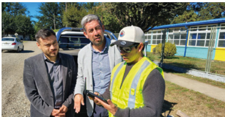
Inician mediciones topográficas para pavimentación de calles de Radal