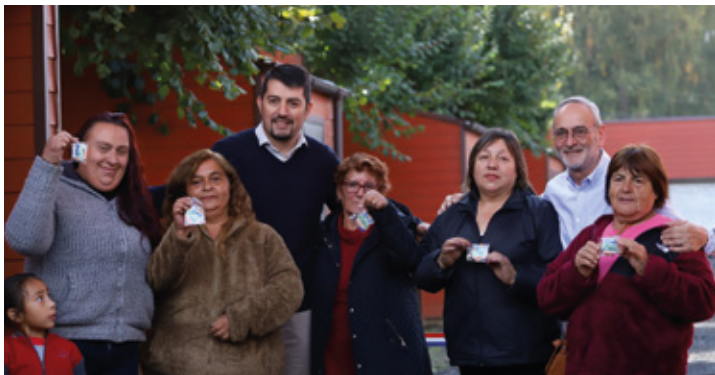
Gorbea impulsa el desarrollo local con la inauguración del nuevo mercado municipal