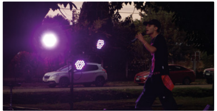
Big Benjita, la nueva voz del reguetón en Freire que sueña con colaborar con artistas