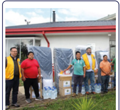
CLUB DE LEONES INTERNACIONAL APOYÓ A AFECTADOS POR INCENDIOS