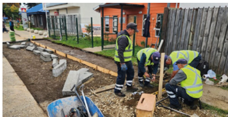
Freire inicia obras de estacionamientos y accesibilidad universal