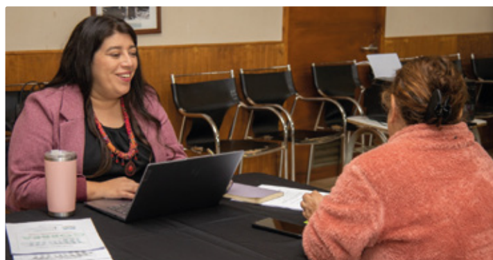
Municipalidad de Gorbea acerca los servicios a la comunidad