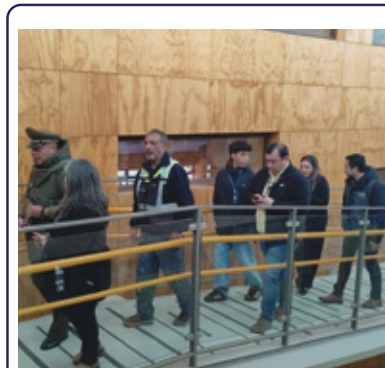
CARABINEROS LIDERA OPERATIVO DE RESGUARDO EN LICEO CIENCIAS