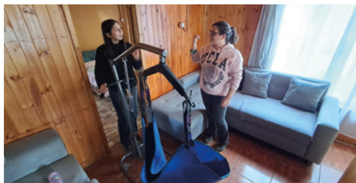
Casa de la inclusión entrega apoyo técnico a personas en situación de discapacidad