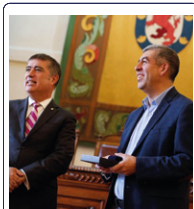
FREIRE Y SANTIAGO FIRMAN CONVENIO DE COLABORACIÓN