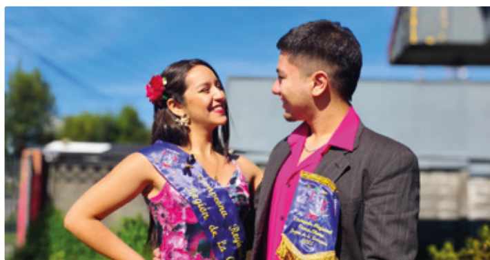
Desde Freire al escenario nacional de cueca chora: pareja campeona invita a bingo