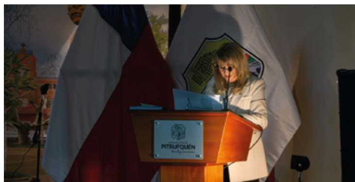
Municipalidad de Pitrufrquén rindió cuenta pública 2025