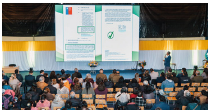
Municipalidad de Freire presentó cuenta pública gestión 2025