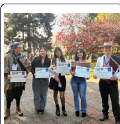
JÓVENES DE PITRUFQUÉN RECONOCIDOS COMO "TALENTOS DE LA ARAUCANÍA"