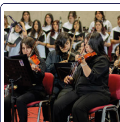
PITRUFQUÉN SE LLENARÁ DE VOCES EN GRAN ENCUENTRO CORAL JUVENIL