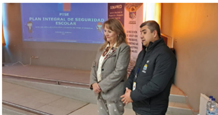
Promueven la aplicación de planes integrales de seguridad