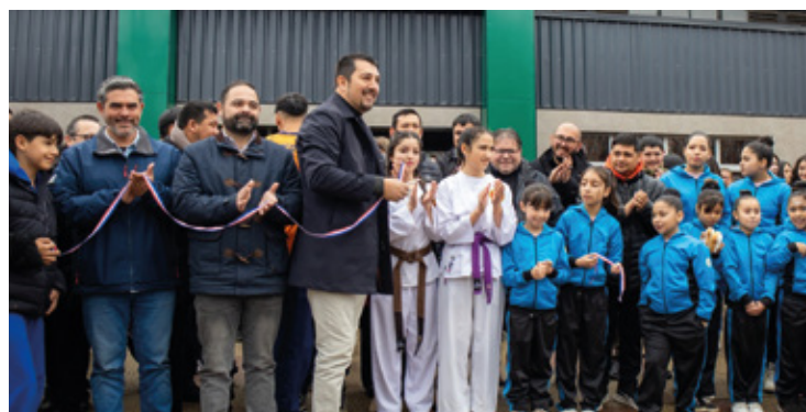
Gorbea inaugura mejoramiento del gimnasio municipal