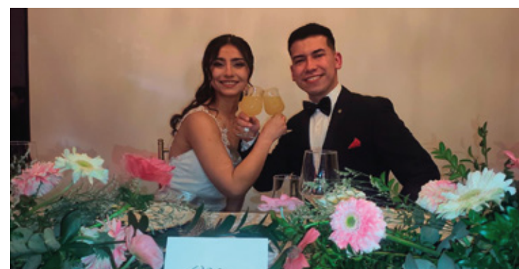
Centro de eventos inaugura su propuesta con espectacular puesta en escena