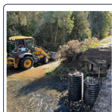
AVANZA REPOSICIÓN DE PUENTE EN LOLEN