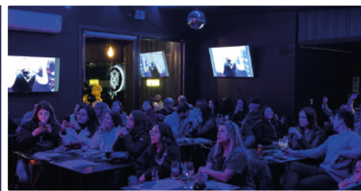
Brava social club: gastronomía y entretención revitalizan la noche de Pitrufquén