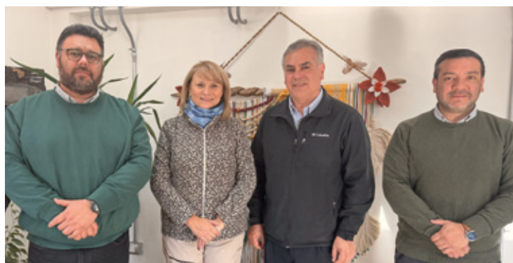
Impulsan creación de centro de rehabilitación de alcohol y drogas