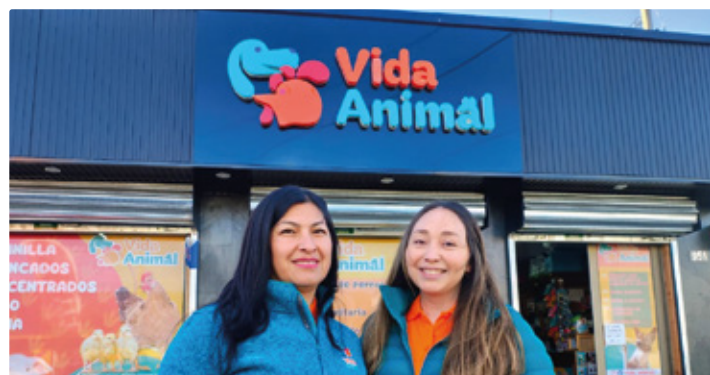
Joven familia apuesta por emprender en Pitrufquén con Vida